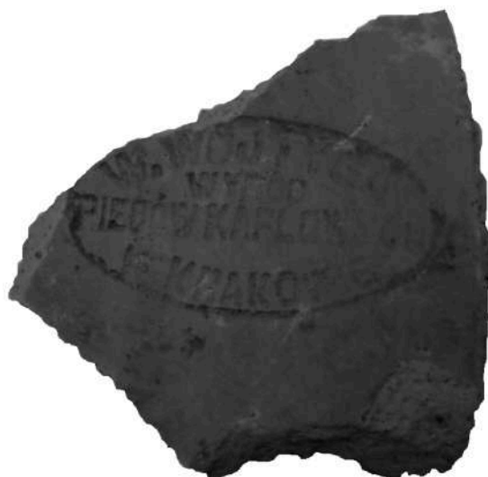
Ryc. 3. Sygnatura wytwórcy „W.WOJTYGA / WYRÓB / PIECÓW KAFLOWYCH / W KRAKOWIE” znajdująca się na spodniej stronie płytki kafła.